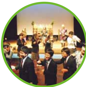
北海道修学旅行(アイヌコタン)