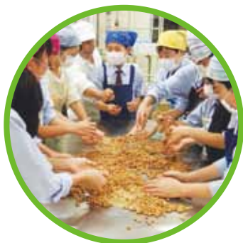
醸造体験(味噌作り)

THE THIRD JUNIOR HIGH SCHOOL, TOKYO UNIVERSITY OF AGRICULTURE