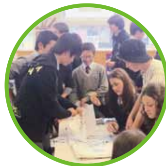
ニュージーランドホームステイ