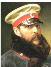
ロシア皇帝アレクサンドル 2 世

軍服バージョンの肖像画です。改革の成果が発揮されたのか、露土戦争は圧勝に終わった。海がダメなら、陸から南下。うまくいったと思いきや…。