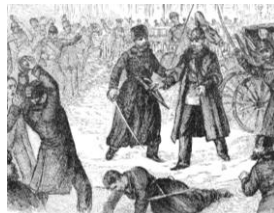
アレクサンドル2世の暗殺

ナロードニキの運動は、農民に全く相手にされなかった。この絵は農家で逮捕されるナロードニキを描いたもの。