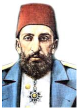
アブデュルハミト 2 世

非常に評価が分かれるスルタンである。オスマン帝国の滅亡を早めたとも、近代化をもたらしたとも言われる。