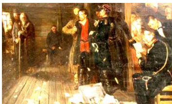
レーピン作「ナロードニキの逮捕」

ナロードニキの運動は、農民に全く相手にされなかった。この絵は農家で逮捕されるナロードニキを描いたもの。